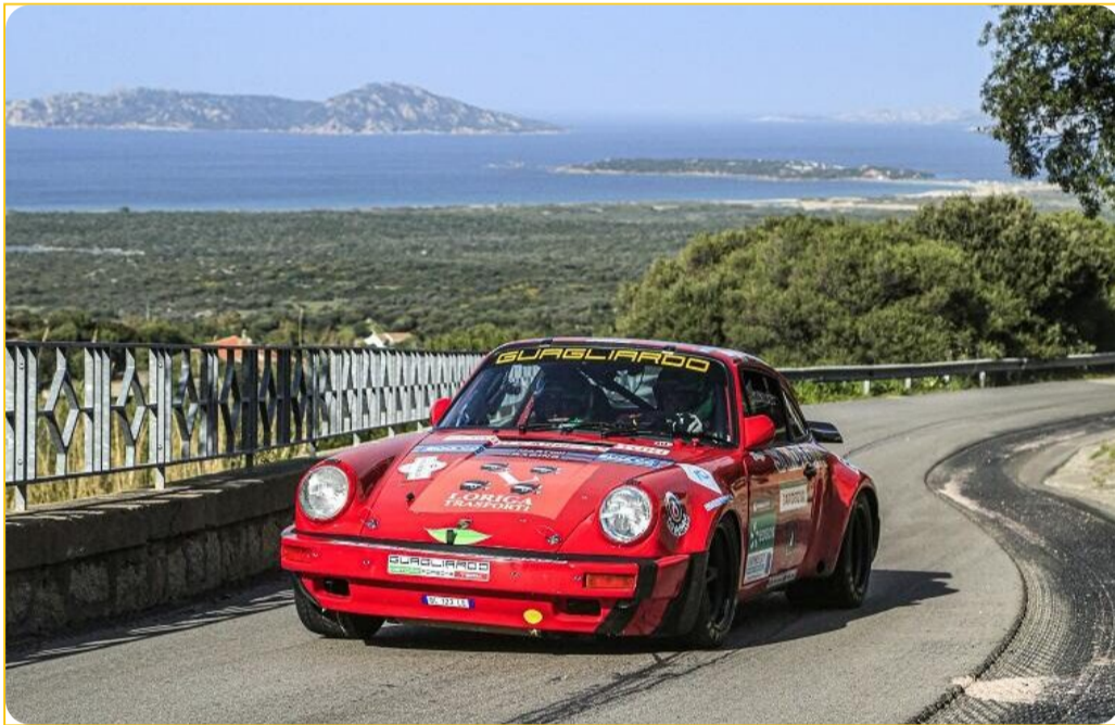
Farris-Pirisinu al Rally Costa Smeralda

VIA SAN BENEDETTO 29 GARAU AGENZIA E FIORICOLTURA